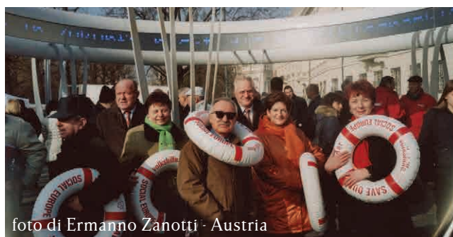
Austria